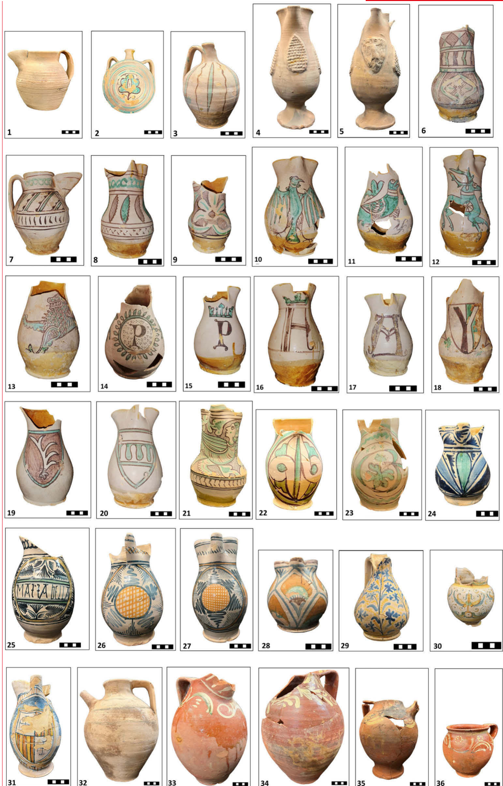
Ceramiche rinvenute nel pozzo del convento di San Pietro in Vetere (Orvieto)

Sempre a Castelseprio, ma nel borgo esterno, lo scavo di un’abitazione bassomedievale (datata al 1190±190) rappresenta un esempio virtuoso di integrazione metodologica. Il LiDAR ha consentito di costruire un Digital Terrain Model per riconoscere le