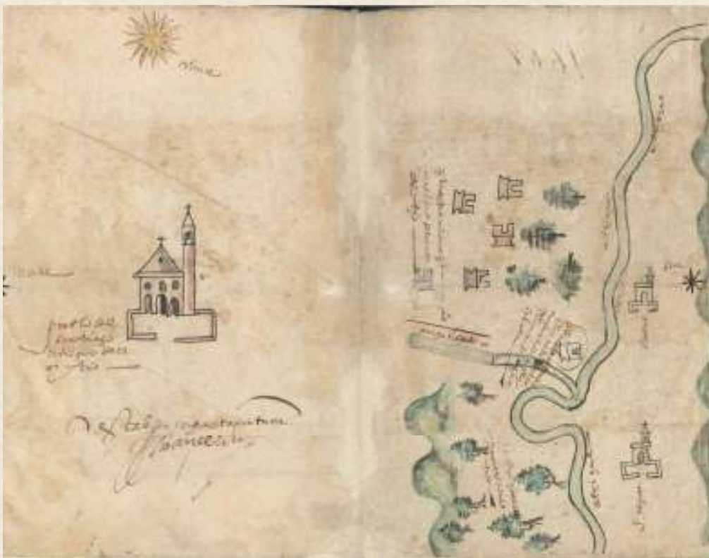
Figura 5. Ms. 5, ff. 5v-6r. Mapa de Santiago Tecali , documento administrativo. Referencia: 54854

con la posesión de un molino y tierras cercanas. Destaca la presencia de un título de tierras escrito en náhuatl, que se encuentra en la foja 60r-v. Al igual que el mapa del pueblo de Santiago Tecali, en las hojas 5v y 6r, en el que se pueden ver el atrio del convento, otras capillas religiosas, construcciones civiles, vegetación, un río llamado Atoyaque, y la cordillera de la sierra de Amozoc. El mapa fue elaborado siguiendo la tradición indígena, pero con una organización espacial europea, ya que en ambas hojas hay una rosa de los vientos que indica el norte y el sur, y en el folio 5v un sol señala el oriente.