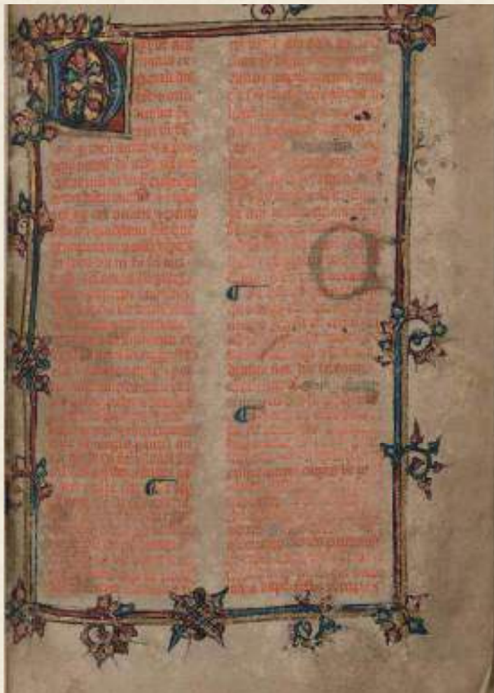
Figura 1. Ms. 1, f. 1r. Breviarium romanum

manuscrito tiene dos sellos de tinta: uno del Colegio del Espíritu Santo de Puebla y otro de la Biblioteca Pública de Puebla de Zaragoza.