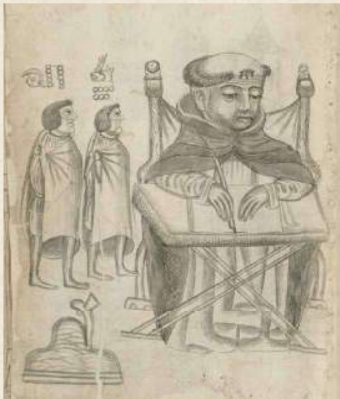
Figura 3 Ms. 3, f. 4v. Códice de Yanhuitlán . Procedencia: Academia de Bellas Artes de Puebla. Referencia: 86922

Desde el punto de vista estético y estructural, el códice es una fusión notable de dos mundos: el europeo y el indígena. A lo largo de sus hojas, pueden observarse elementos característicos de la tradición prehispánica, tales como el uso del glifo del año, la representación de topónimos y prefijos que se entrelazan con anotaciones manuscritas en diversas partes del texto. El códice refleja la convivencia plena con la cultura española, al incluir las figuras del encomendero, del evangelizador, así como de alcaldes y corregidores, evidenciando la compleja realidad social y política de la época.