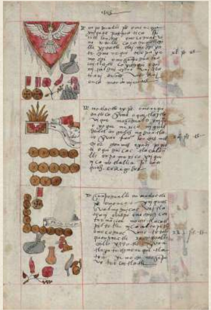
Figura 2. Ms. 2, f. 59r. Códice Sierra- Texupan . Procedencia: Academia de Bellas Artes de Puebla. Referencia: 48281

Este manuscrito llegó a Puebla en el siglo XIX, junto con otro importante códice llamado Yanhuitlán (que también forma parte de la misma colección). Ambos fueron donados por el obispo Antonio Joaquín Pérez y Martínez (1763–1829) al Museo de Antigüedades y Conservatorio de Artes y Oficios de Puebla, que abrió en 1827. Más tarde, estas colecciones se trasladaron a la Academia de Educación y Bellas Artes, inaugurada en 1813, donde se registraron en el inventario de 1848. Finalmente, en 1972, todas estas colecciones pasaron a formar parte de la Biblioteca Lafragua de la BUAP. Debe mencionarse que, en 2016, este códice recibió el reconocimiento de Memoria del Mundo México, un honor que destaca su importancia histórica y cultural.