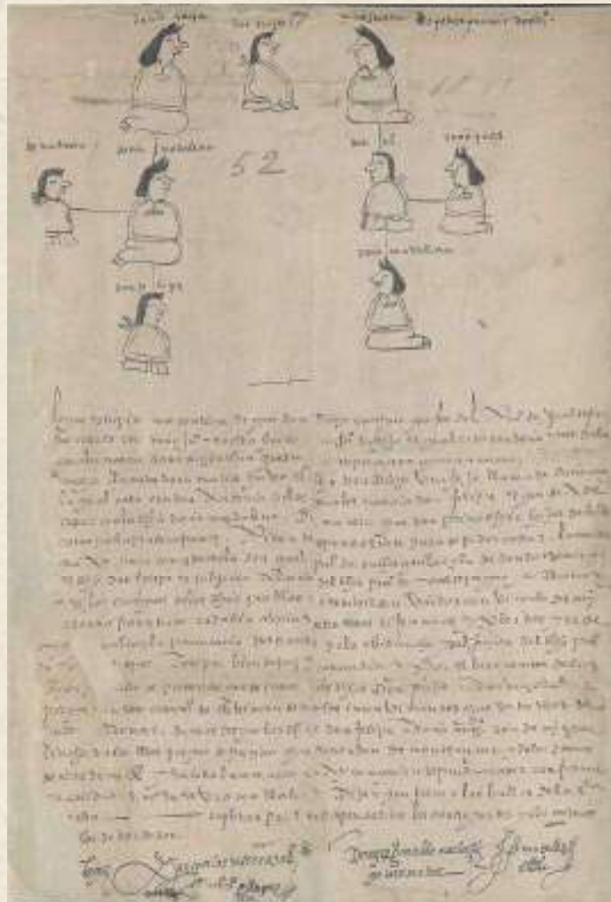
Figura 6. Ms. 6, f. 1r. Genealogía de San Juan Ihualtepec. Referencia: 88998

nio de ambos personajes, cuyo fin fue asegurar la paz y la armonía comunitaria. Por ello el singular valor de la ornamentación que ocupa la mitad superior del manuscrito, donde se despliega una genealogía ilustrada con la elegancia pictórica propia de la tradición prehispánica, característica de la Mixteca Baja. Nueve figuras humanas, representadas sentadas o arrodilladas, se hallan unidas por una línea genealógica que denota sus lazos familiares, enriquecida por la inclusión de sus nombres cristianos, reflejo de la convergencia cultural de la época.