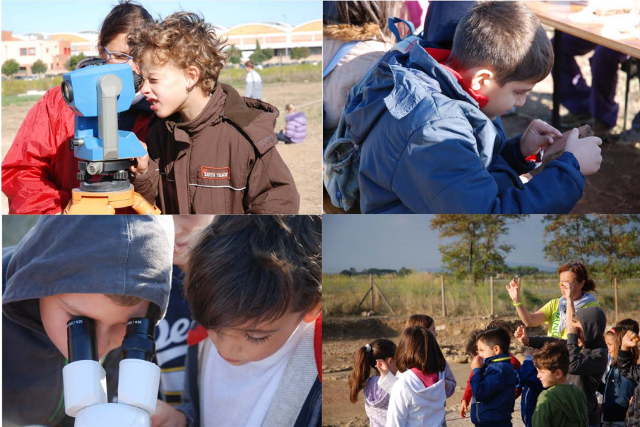
Fig. 7. Attività di laboratorio sul cantiere con i bambini della scuola primaria di Riotorto