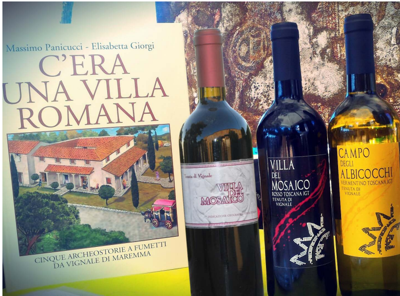
Fig. 9. Scavi, storie, etichette per costruire una immagine nuova di un prodotto del territorio