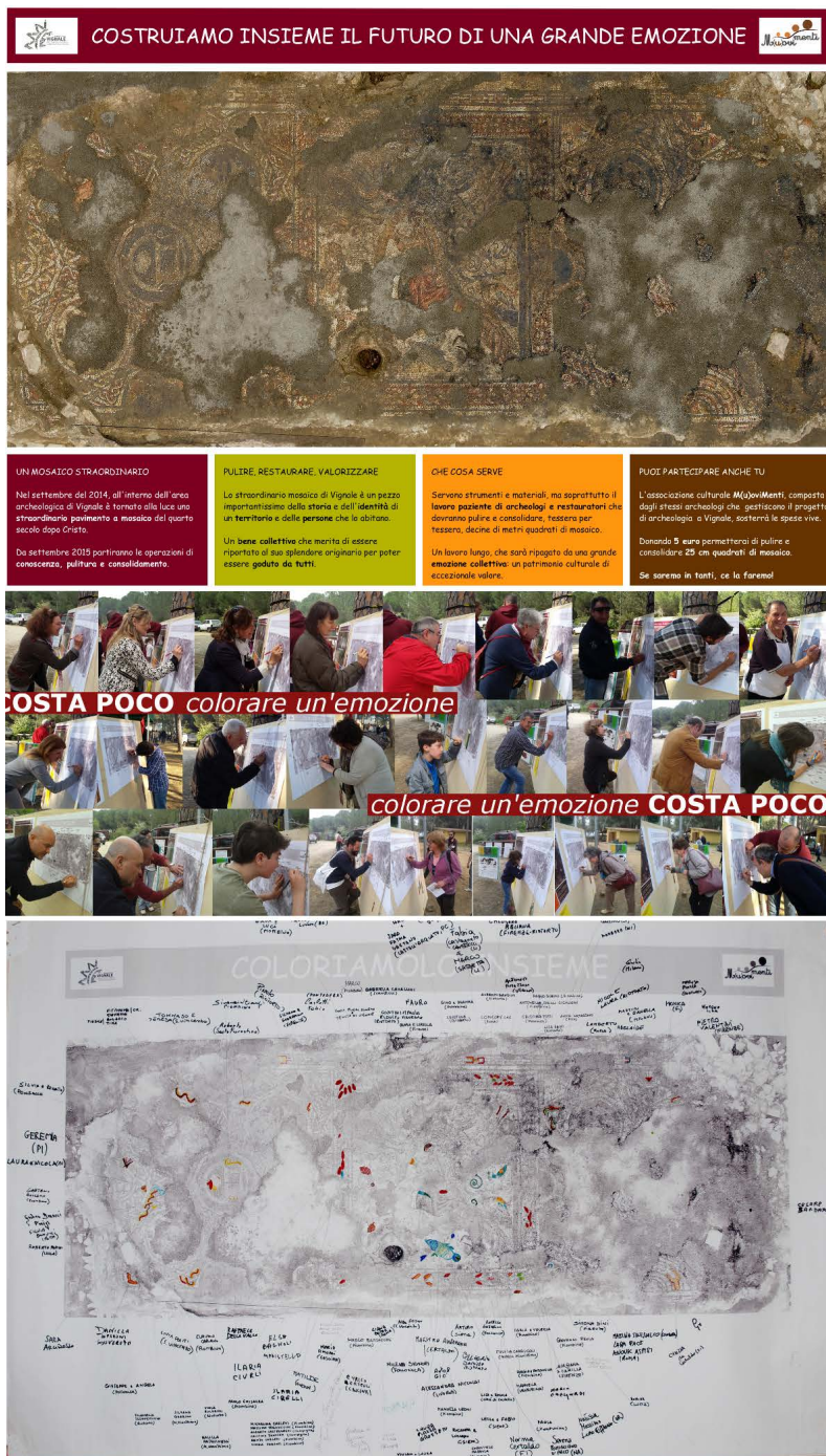
Fig. 8. Campagna di crowdfunding per finanziare il primo intervento conservativo sul mosaico appena scoperto