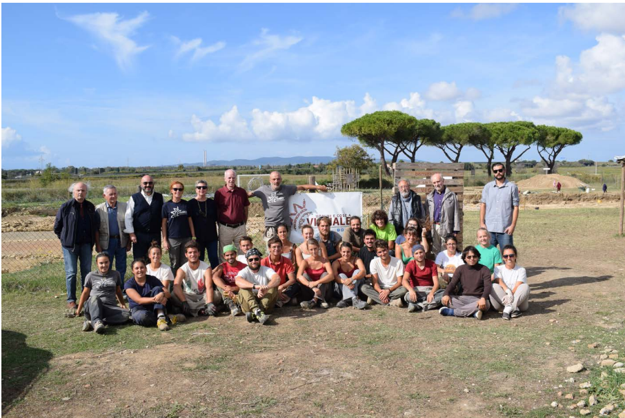
Fig. 4. Scenario fisico e umano di un progetto di archeologia condivisa: gli archeologi, lo scavo e alcuni dei “mediatori” con la comunità