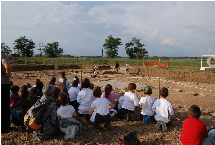
Fig. 6. Lo scavo come scenario per una conoscenza immersiva