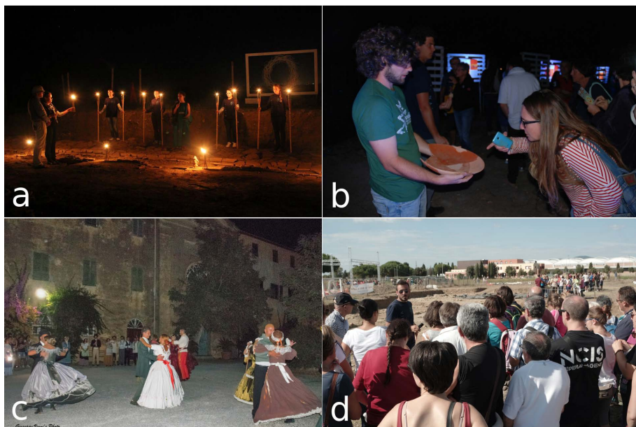
Fig. 5a), b), c). Alcuni degli eventi della serie “Ancora una notte a Vignale”, organizzati in collaborazione con l’Ass. Cultura e Spettacolo Riotorto e con Teatro dell’Aglia di Piombino (a); Ass. Riolab di Riotorto (b); Ass. Follos 1838 di Follonica (c); d) un momento dell’apertura straordinaria del cantiere in occasione di Poderando, in collaborazione con Ass. Trekking Riotorto