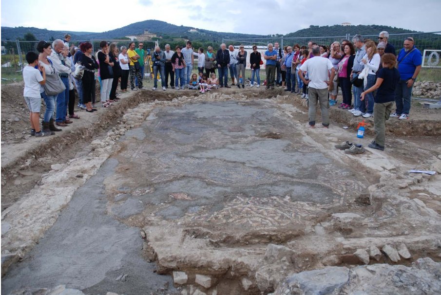
Fig. 3. Condivisione con la comunità di Riotorto delle prime impressioni sul grande mosaico tardoantico pochi giorni dopo la scoperta