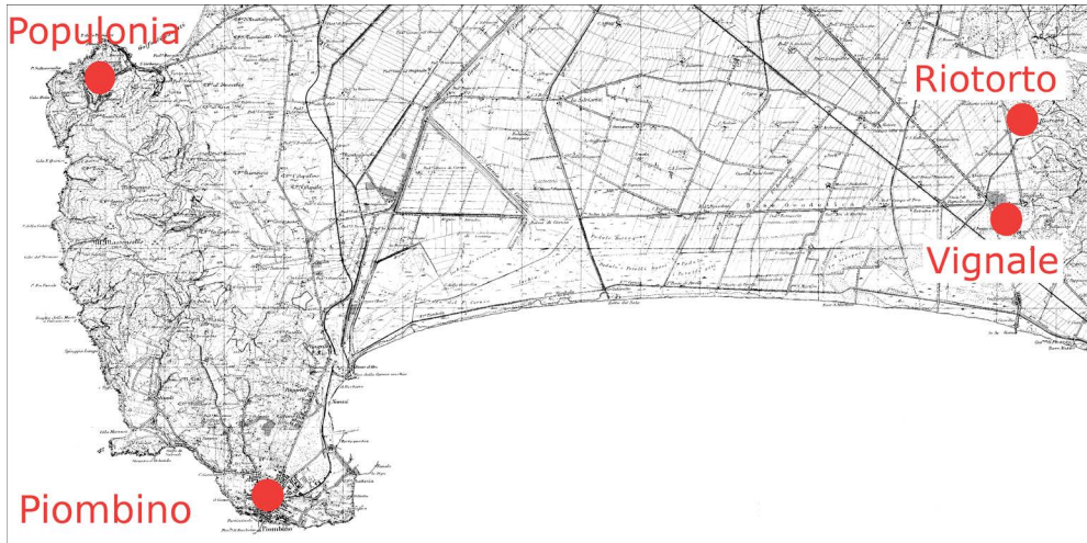
Fig. 1. Lo scenario geografico del progetto “Uomini e cose a Vignale”