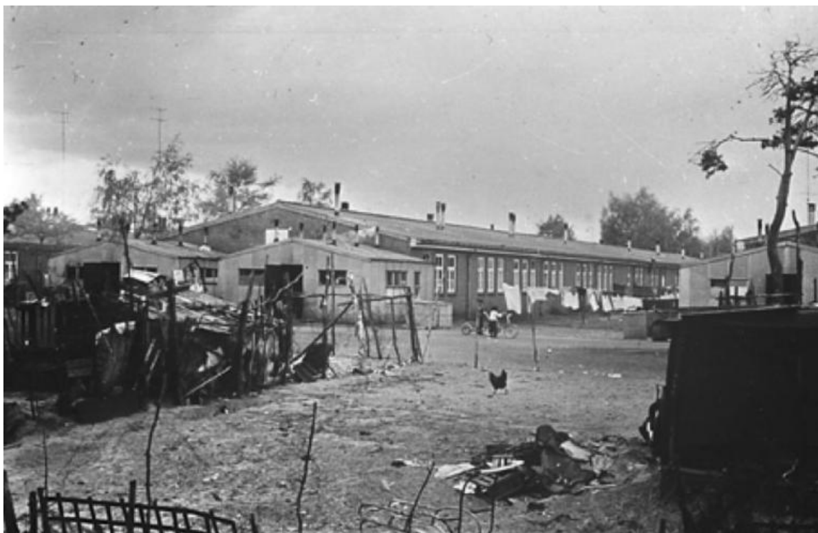
Le baracche dei profughi molucchesi.