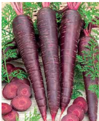
Fig. 8 – Carota Purple Sun