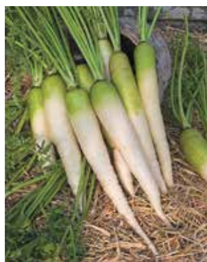
Fig. 5 – Carota Bianca a colletto verde (da www.graines-baumaux.fr )