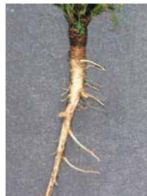
Fig. 2 – Radice di carota selvatica.

una pianta comune nei luoghi incolti, bienne, che produce nel primo anno una rosetta basale di foglie pennatosette, cui segue nel secondo anno un fusto alto fino a un metro, con all'apice una caratteristica ombrella composta, con fiori bianchi e uno o più fiori centrali rossi o porpora, sterili (Fig. 1). Dopo