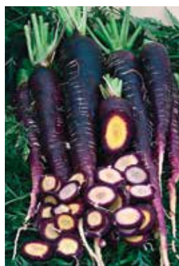
Fig. 4 – Carota Morada

Come già in precedenza notato, la diffusione delle carote arancioni ha portato alla graduale scomparsa delle varietà diversamente colorate, in precedenza ampiamente diffuse. Una meritoria opera di salvaguardia della biodiversità ha comunque consentito la conservazione e il recupero di molti antichi tipi di