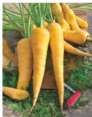
Fig. 6 – Carota Gialla Goliath