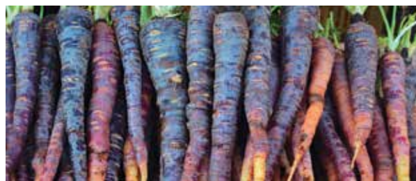
Fig. 3 – Carota di Tiggiano

bianco e con foglie finemente suddivise, e la carota orientale D. carota ssp. sativus var. atrorubens Alef., con radici viola, porpora, rosso o raramente giallastre e foglie scarsamente divise (Small, 1978; IPGRI, 1998).