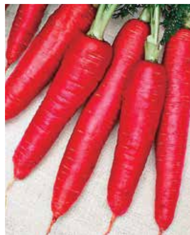
Fig. 10 – Carota Atomic Red

carota, mentre altri, per i motivi commerciali già ricordati, sono stati selezionati in questi ultimi anni. In Italia sono rimasti due tipi tradizionalmente coltivati in Puglia: la Carota di Polignano o di San Vito (Bari) e la carota di Tiggiano o di Sant'Ippazio (Lecce), entrambe chiamate giallo-viola per la presenza di radici di colore molto variabile (Fig. 3), entrambe inserite, assieme all'arancione Carota di Zapponeta, fra i Prodotti alimentari tradizionali pugliesi riconosciuti tali dal MiPAAF. Volendo ricordare altre varietà colorate tuttora coltivate possiamo citare fra quelle storiche Morada (spagnola, viola – Fig. 4), Rossa lunga sanguigna, Bianca di Küttingen (Svizzera), Bianca dei Vosgi, Bianca di Fiandra a colletto verde (Fig. 5), Gialla di Doubs (francese), Gialla di Lobberich (tedesca), Gialla Goliath (austriaca - Fig. 6), e fra quelle di più recente ottenimento Purple Haze (Fig. 7), Deep Purple e Purple Sun (Fig. 8) (viola), Purple Dragon (rosso porpora – Fig. 9), Atomic Red (Fig. 10) e Red Samurai (rosse), Gold Nugget (gialla), Mello Yello (gialla a colletto verde), White Satin (bianca).