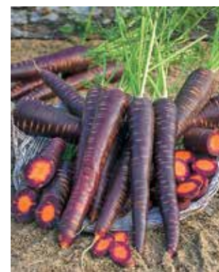
Fig. 7 – Carota Purple Haze