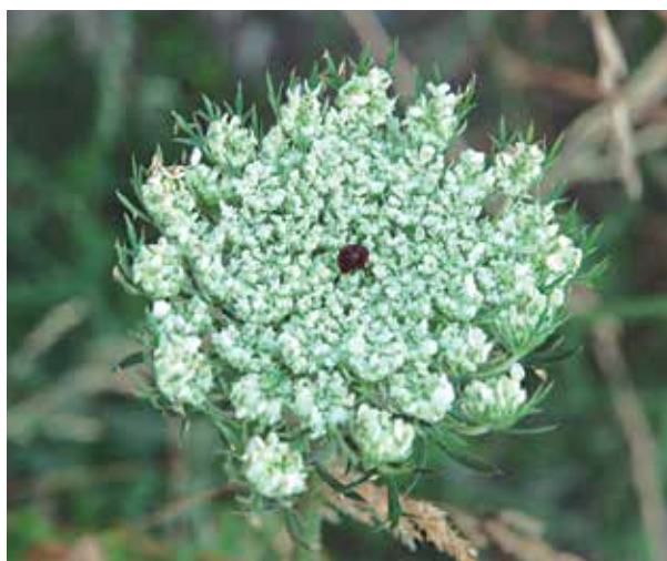
Fig. 1 – Infiorescenza ad ombrella composta di Daucus carota L., con il caratteristico fiore centrale sterile di color viola.