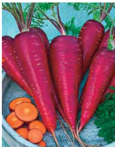
Fig. 9 – Carota Purple Dragon