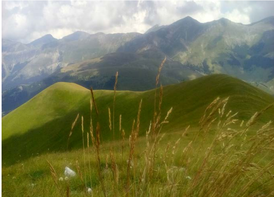
Piane di Castelluccio di Norcia 24 agosto – 30 ottobre 2016