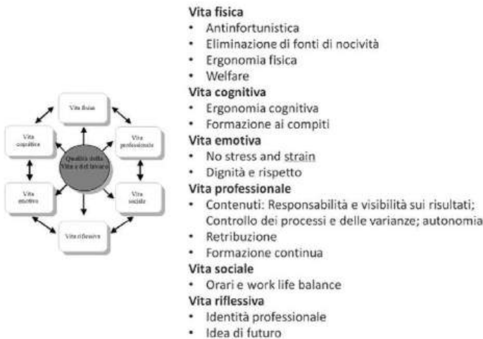
Figura 1 – Il modello della qualità della vita.

L'integrità emotiva è ciò che consente di padroneggiare ( coping ) fatica mentale, stress, tensione, nevrosi, psicosi che sono in molti casi co-generate da un'organizzazione del lavoro inadeguata. L'integrità professionale si riferisce al bisogno di riconoscere la propria identità professionale, di proteggere la propria esperienza, di apprendere cose nuove. L'integrità sociale riguarda i ruoli sociali nella famiglia e nella comunità. L'ultimo criterio, il più importante di tutti, è l'integrità del sé. Esso non è la somma degli altri. Se c'è un attacco all'integrità emotiva o all'integrità cognitiva, se ci sono dei turni impossibili, una persona potrebbe non sapere più neanche chi è. Ma anche quando nessun altro parametro di integrità sia stato violato, potrebbero esserci casi in cui la persona non riconosca il proprio (o i propri) sé: è quello che Durkheim chiamava anomia, che Marx chiamava alienazione e che Mounier e Maritain attribuivano a un mancato autoriconoscimento di sé come persona. In questo mondo di grande cambiamento, il problema del senso dell'identità è un problema sociale molto importante per le persone, per le organizzazioni e per la società. Il riconoscimento di sé non è contemplazione, ma per un verso mobilitazione di energie per l'autodifesa dell'integrità di tutte le dimensioni della persona, per un altro valorizzazione e affermazione di sé vincendo la 'lotta per il reale' e la 'padronanza dell'azione', come dice Mounier.