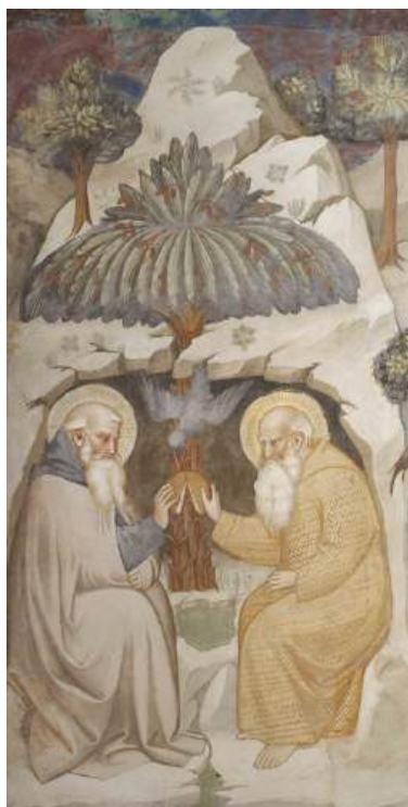
Figura 3 – Pittore fiorentino, Il pasto condiviso tra Antonio, 1368-1372. Firenze, Firenze, ex chiesa di Santa Maria al Sepolcro (Le Campora), cappella di Sant’Antonio abate, affresco.