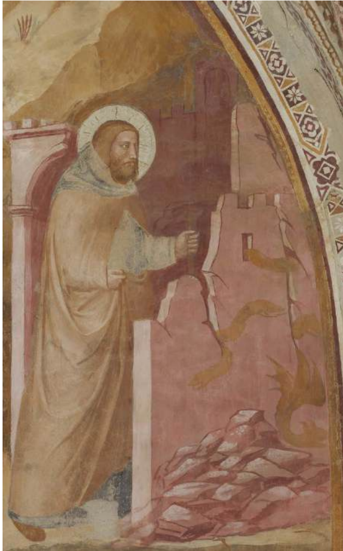
Figura 2 – Pittore fiorentino, La distruzione dell'eremo di Antonio, 1368-1372. Firenze, Firenze, ex chiesa di Santa Maria al Sepolcro (Le Campora), cappella di Sant'Antonio abate, affresco.