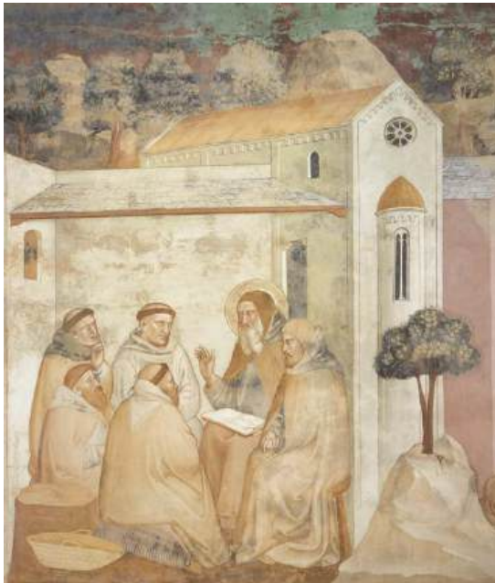
Figura 1 – Pittore fiorentino, Antonio tra i monaci, 1368-1372. Firenze, Firenze, ex chiesa di Santa Maria al Sepolcro (Le Campora), cappella di Sant'Antonio abate, affresco.