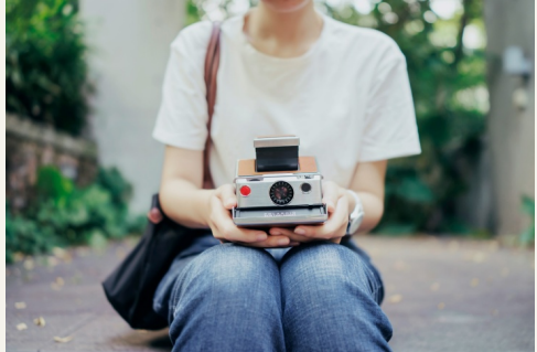
Ritratti di famiglia