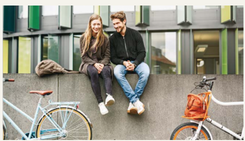
Come (non) scegliamo la forma delle nostre famiglie di Claudia Bruno