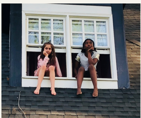
Fuori dalle famiglie di Monya Ferritti