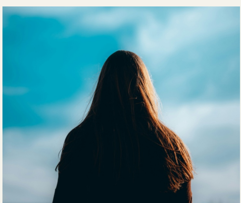
Inverno demografico di Paola Villa