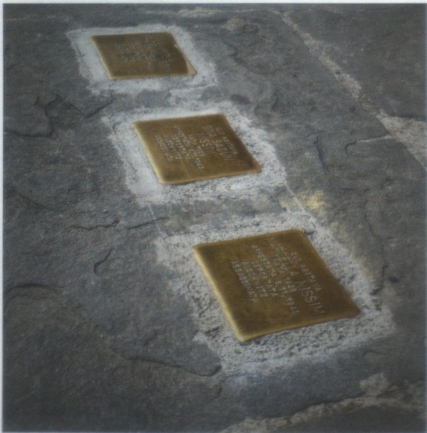
Fig. 1: Tre delle sette pietre d'inciampo installate a Siena in occasione della Giornata della Memoria del 2025.

10 Giornata della Memoria 2025: Pietre d'Inciampo a Siena e Provincia , tratto dal sito web di Fondazione Musei Senesi, https://www.museisenesi.org/eventi/giornata-della-memoria-2025-pietre-d-inciampo-a-siena-e-provincia/#:~:text=Il%2030%20gennaio%202025%20alle,Et%C3%A0%20Contemporanea%20%E2%80%9CVittorio%20Meoni%E2%80%9D .