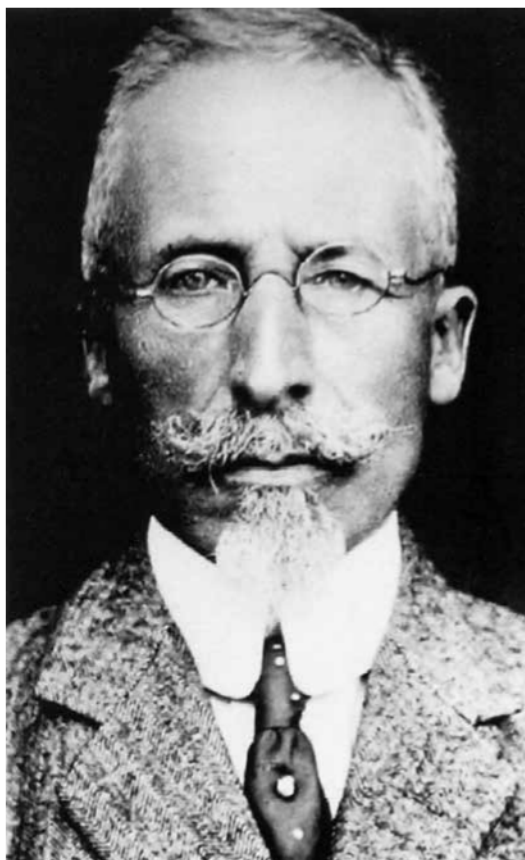
Figura 1. Salvatore Ottolenghi

Allievo di Cesare Lombroso all'Università di Torino, ma con prevalente formazione medico-legale, a Ottolenghi va ampiamente riconosciuto il merito di aver compreso il bisogno di nuovi metodi di identificazione personale, oggettivamente più validi, e di aver operato in tal senso. “Intuì la necessità di metodiche più accurate, non limitate ai dati essenziali dei connotati relativi alla corporatura, alla statura, al colore dei capelli e degli occhi, alla barba, ai segni particolari, posto che tali indicazioni si rivelavano del tutto insufficienti, prive come erano di aggettivi di valore universale e di comune riscontro” (Martini & Piva, 1993, p. 64).