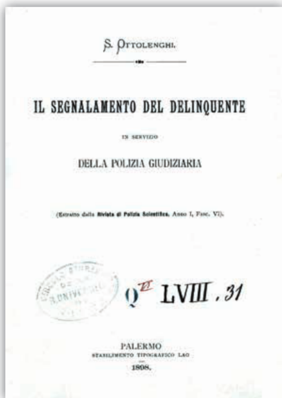
Figura 2. Salvatore Ottolenghi, Il segnalamento del delinquente in servizio della Polizia giudiziaria

quando dai dati comunicati si riesce a scoprire la persona ricercata” (Ottolenghi, 1898, p. 15). Motivava l’affermazione nel seguente modo: “I lineamenti del viso se non sono studiati scientificamente non servono a nulla; paiono uguali [...]. Occorre uno studio in cui all’impressione soggettiva venga sostituendosi più che è possibile quella oggettiva, eliminando il più possibile l’apprezzamento dell’individuo. [...] La colpa sta nel ritenere la capacità di segnalazione del delinquente come proprietà comune intuitiva di qualsiasi persona, senza bisogno di cultura speciale, mentre invece la faccia umana si può ben dire è la pagina di un libro che non si lascia leggere che da chi ne ha appreso l’alfabeto” (Ottolenghi, 1898, pp. 15-16). Il problema fondamentale stava pertanto, a suo avviso, nella necessità di introdurre nuove metodiche ed elementi di identificazione svincolati da ogni impressione soggettiva e di una specifica preparazione dei funzionari di Polizia. Secondo lui, bisognava passare da una “polizia empirica” a una “polizia scientifica” (Ottolenghi, 1898, p. 22).