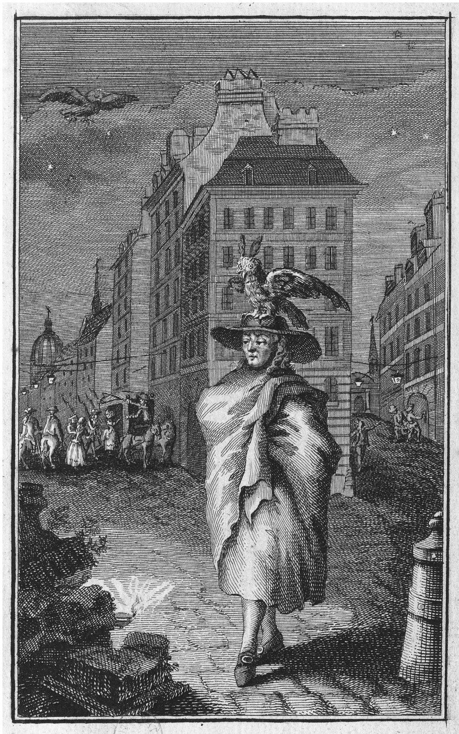
Immagine 2 – Jean Michel Moreau, dit le Jeune, Frontispice de « Les Nuits de Paris » . L'auteur est Spectateur-nocturne, accompagné du Hibou-spectateur (1788).

David Matteini, "Une fenêtre sur la ville": pratiche dello sguardo nella Parigi prerivoluzionaria.