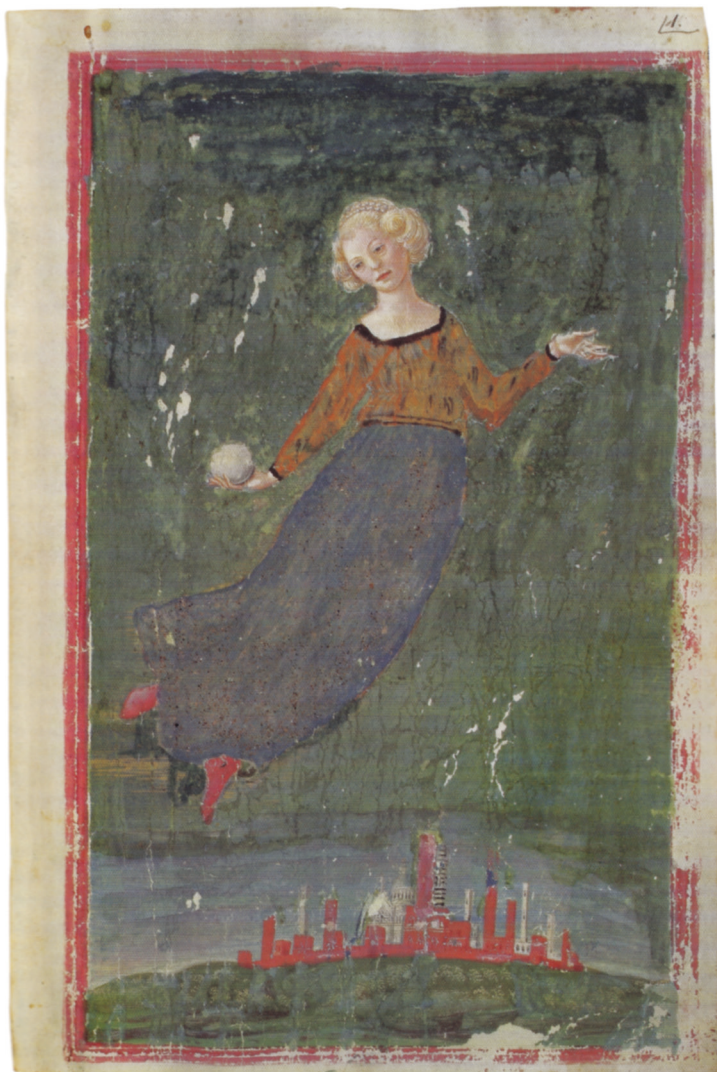
Fig. 1. Francesco di Giorgio Martini, Bianca Saracini si libra sopra la città di Siena . BNCF, Palatino 211, c. 1r.