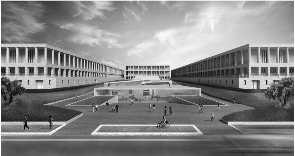
Fig. 7. Rendering della piazza coperta vista dal viale dell'Arte.

L'investimento complessivo richiesto per la realizzazione del progetto ammonterebbe a circa 45 milioni di euro. Nell'ipotesi in cui l'INAIL mantenesse la proprietà dei nuovi depositi, l'Archivio centrale potrebbe fruire di tale spazio versando un canone di locazione annuo di 1,6 milioni di euro annui, pari al 4% del valore del nuovo immobile. Un simile canone risulterebbe nettamente inferiore rispetto ai 2,5 milioni di euro annui che lo stesso Ministero già versa per l'affitto dell'edificio laterale sinistro, il quale potrebbe essere quindi dismesso e rimesso alla disponibilità dell'INAIL. Lungi dal comportare costi aggiuntivi per il MiBACT, questa proposta si tradurrebbe al contrario in un risparmio di circa un milione di euro sui canoni di affitto correnti. La spesa per la conservazione della documentazione dagli attuali 40 euro annui per metro lineare potrebbe ridursi infatti a 8 euro, a fronte del raddoppio della superficie destinata ai depositi. Ciò consentirebbe peraltro di riunire in un unico complesso non solo la documentazione che si trova oggi nei depositi di Pomezia, ma anche quella degli archivi di Camera e Senato, parcellizzati in locali in affitto variamente distribuiti in città.