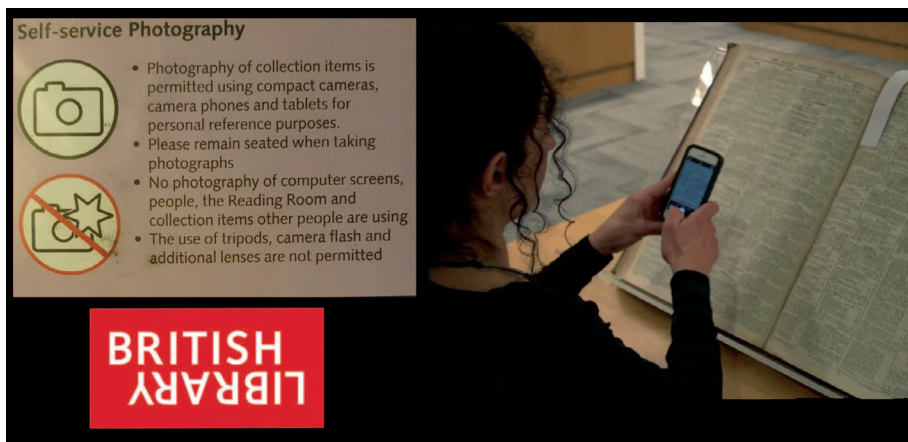
Fig. 1. La riproduzione con mezzo proprio nelle sale studio. Fotogramma tratto dal video tutorial diffuso in rete dalla British Library: < http://www.bl.uk/reshelp/inrooms/stp/copy/selfsrvcopy/book_photography_video.mp4 >.